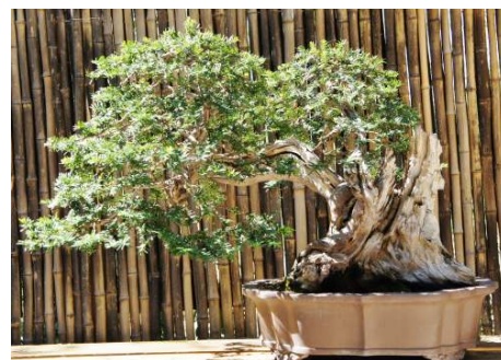
Parcs et jardins