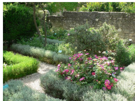
Parcs et jardins